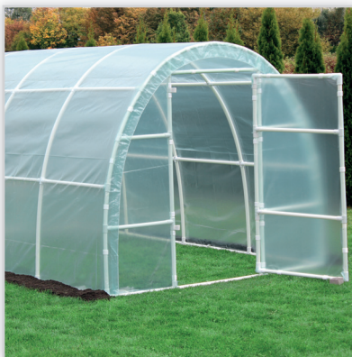
LEMAR, Tunele foliowe lekkie łatwe w montażu. Konstrukcja: stelaż z białych rurek PVC o średnicy 32 mm odpornych na korozję i zmianę temperatury; na stelażu napinana jest folia ogrodnicza (na 4 sezony) i przypinana do rurek specjalnymi spinkami. Podstawą tunelu jest rama z rur PVC wzmocniona kształtkami, którą mocuje się do ziemi za pomocą szpilek metalowych. Przód i tył tunelu to prostokątne drzwi mocowane na zawiasach. Zalety: lekkość konstrukcji, łatwy i szybki montaż.