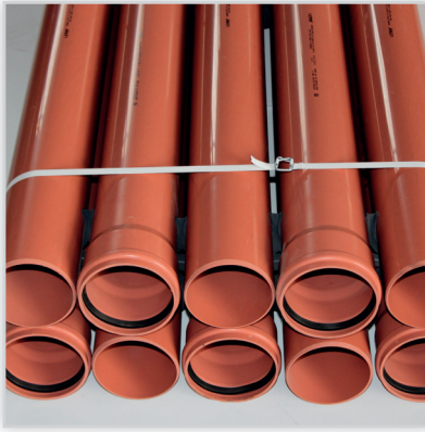
LEMAR, Rury kanalizacyjne z PVC-U. Zastosowanie: do budowy sieci kanalizacyjnych. Srednica [mm]: 315, 250, 200, 160, 110, 75, 50. Normy: PN-EN 1401-1:2009, PN-EN 12200-1:2002.