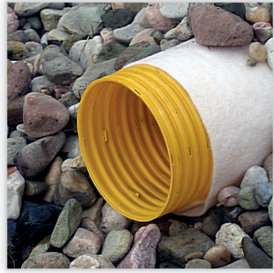
LEMAR, Systemy drenarskie z PVC-U. Elementy systemu: rur drenarskich PVC, kształtek, studzienek i jako uzupełnienie, geowłókniny. Akcesoria pomocnicze: złączki drenarskie, trójniki oraz redukcja 100/80, a dodatkowo także zaślepki drenarskie. Zwoje [m]: 50. Srednica rur [mm]: 100, 80 oraz 50.