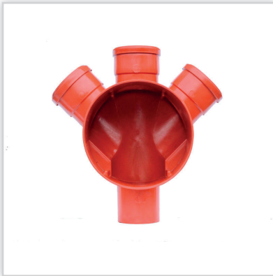
LEMAR, Podstawa studni (kineta). Materiał: PP o wysokiej odporności na uderzenia i zmianę temperatur, dużej trwałości i odporności chemicznej na agresywne ścieki. Srednica przelotu [mm]: 160 i 200 (kinie ty przelotowe i zbiorcze z wlotami pod kątem 45° lub jednostronne, prawe/lewe – dowolnie wykonywanie przyłącza – bez kolan i redukcji). Zalety: gładkie wyprofilowane dno wpływa na dobrą charakterystykę hydrauliczną, żebra usztywniające konstrukcję oraz ułatwiające posadzenie w gruncie.