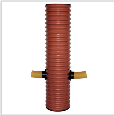
LEMAR, Studzienki drenarskie. Budowa: karbowane rury PCV o średnicy 315 mm + prefabrykowana pokrywa + dno wraz z uszczelkami; w rurze karbowanej wywierane są otwory, w których mocowane są uszczelki in-situ, a w nich z kolei rury drenarskie.