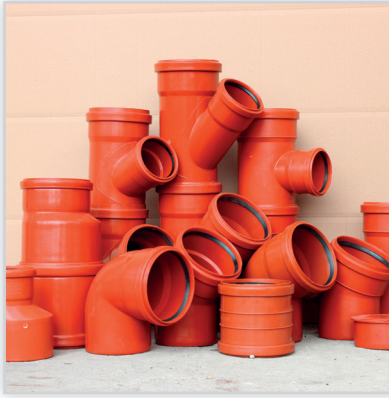
LEMAR, Kształtki kanalizacyjne z PVC-U. Asortyment: trójniki, kolanka, nasuwki, redukcje, korki, itp. Srednice [mm]: 200, 160, 110, 75, 50. Normy: PN-EN 1451-1.