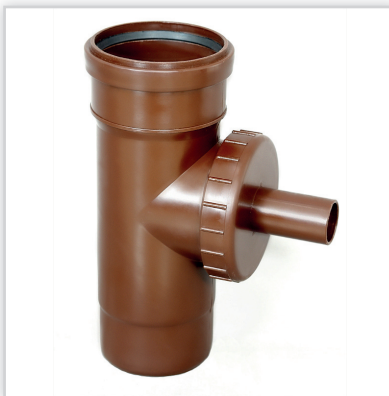
LEMAR, Zbieracz wody deszczowej 110 mm. Montaż: na rurze spustowej budynku na wysokości najwyższego poziomu wody w zbiorniku (nadmiar wody jest odprowadzany z posesji krótkim przelewowym do studzienki). Estetyczne wykonanie nie zaburza wyglądu systemu rynnowego. Na okres zimowy należy odkręcić nakrętkę z wylewką. Ustawienie zbiorników: w dowolnych miejscach ogrodu, w tunelu, szklarni etc. Normy: PN-EN 607:2005, PN-EN 12200-1:2002. Patent: Pat. 194609 (UPRP).