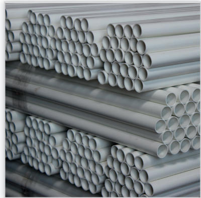
LEMAR, Rury osłonowe PCV. Asortyment: produkowane są w zakresie średnic 315-20 mm; na zamówienie w dowolnym kolorze i grubości ścianki.